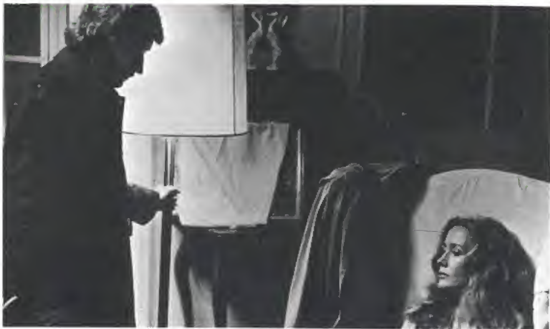
José Sacristán – Brigitte Fossey